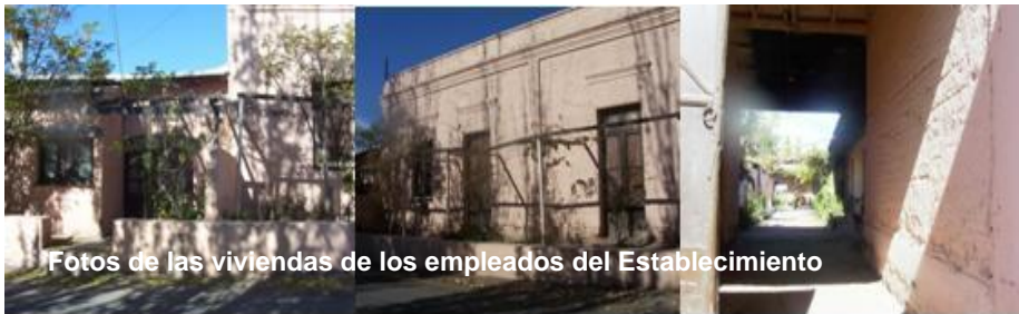
Fotos de las viviendas de los empleados del Establecimiento

En cambio, no todos los establecimientos poseyeron viviendas para obreros. Esto ocasionó que se fueran originando caseríos, pequeños poblados cercanos a las bodegas en las márgenes de los caminos que brindaban servicios a los trabajadores. En el caso de bodega La Rural el establecimiento contaba con viviendas para obreros y trabajadores de diferentes categorías, cuyas fotos mostramos a continuación: