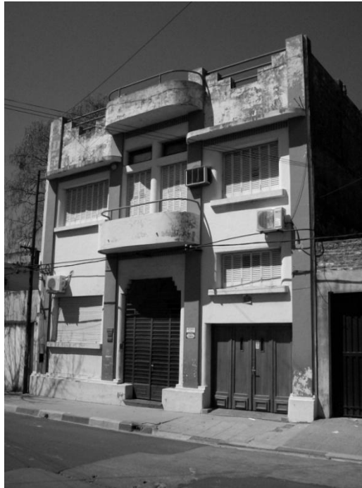
Figura 5. Casa D'Andrea, obra del Ingeniero Enrique Pirchi. La composición en tripartición vertical reforzada por las lisas pilastras otorga un ritmo definido a la fachada mientras que en horizontal se observa cierta libertad compositiva de los llenos vacíos aunque sin perder la idea de basamento, desarrollo y remate propia del clasicismo. Su solidez sobre línea municipal convoca a la unicidad del desarrollo histórico.