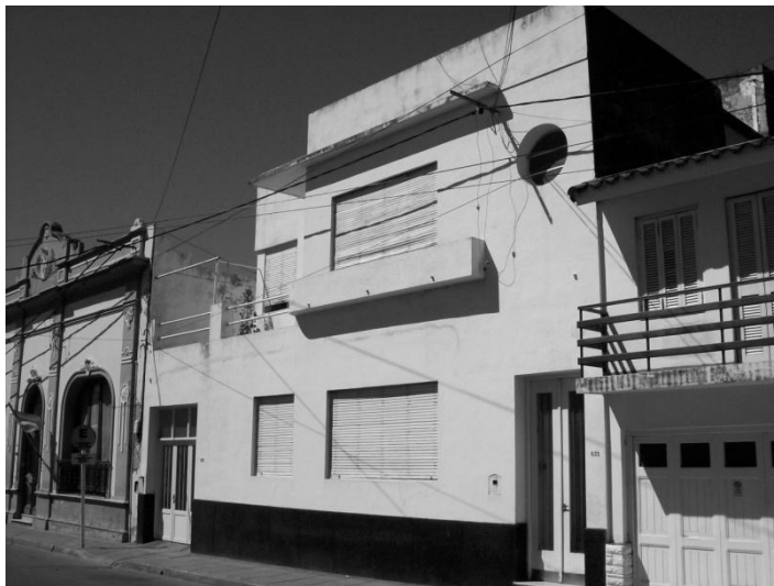
Figura 3. Casa González. Calle Mendoza al 700. Claro ejemplo de Arquitectura Moderna inserta en el área histórico-colonial de la ciudad de Corrientes. Nótese el rígido control que las medianeras adyacentes operan sobre la obra que, más allá de su fuerte impronta formal centroeuropea, la obliga a un comportamiento urbano de corte conservador.