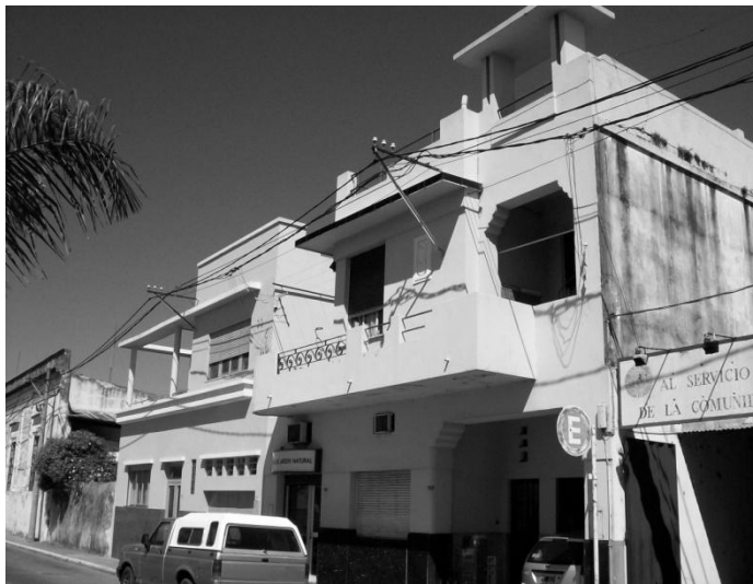
Figura 1. Plácido Martínez al 700. Conjunción de momentos históricos materializados en arquitectura, desde el colonial hasta la modernidad compartiendo modos de construcción de la ciudad.