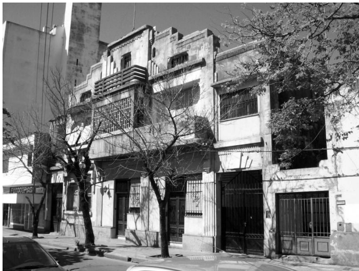
Figura 4. Casa Díaz Colodrero, posteriormente casa Gehan. Las definidas formas y volúmenes Art Déco intentan tímidamente subvertir la disciplina de la línea municipal y del perfil urbano histórico.