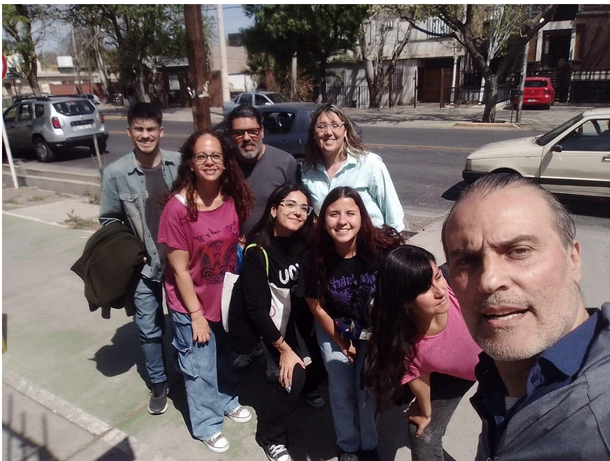
Antes del ingreso a EUCE.