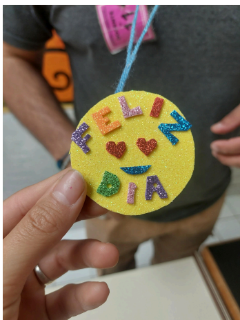
Día del estudiante en EUCE