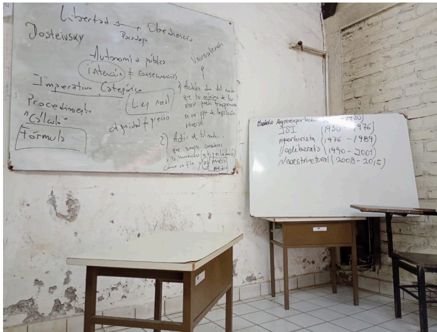
Aula en contexto de encierro.