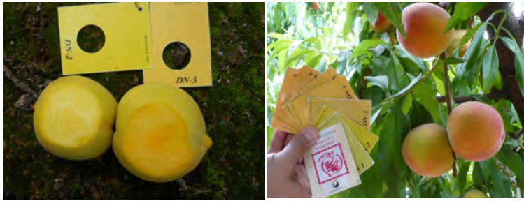
Tabla de colores de la Asoex (Chile).