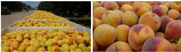
Manejo de la cosecha