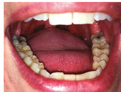
Foto 2: Relación de los bordes linguales con la arcada dentaria inferior.

nico (fuerzas intrínsecas y extrínsecas), entre las estructuras que forman la cavidad bucal, cada arco dentario está en condiciones de aceptar, disipar y ejercer presiones que se producen en el acto masticatorio, sin que ello lesione las estructuras vecinas.