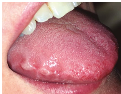
Foto 1: indentaciones, eritema y edema en el borde lingual derecho.