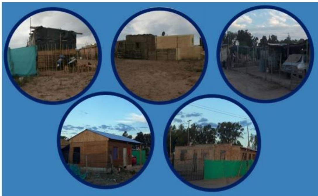
Figura N°3 : Viviendas, tipo de construcción

situaciones muy disímiles en los diferentes lotes. Aunque no de manera exclusiva, estas diferencias pueden explicarse de acuerdo a las inserciones laborales de lxs miembrxs de los hogares. De esta manera, es posible distinguir construcciones excesivamente precarias, otras de material con una estructura más simple y hasta construcciones de más de una planta. La mayor parte de las viviendas cuenta con algún tejido de alambre, rejas o cercos que separan un lote de otro. A su vez, tienen un pequeño jardín delante o detrás de la casa, respetando el formato de vivienda tradicional.