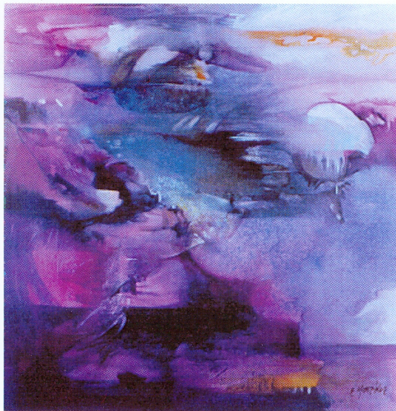
La luna que cae en el mar violeta 2000 Acrílico, 200 x 200 cm.

Profesor de Bellas Artes, egresa de la Facultad de Artes, Universidad Nacional de Cuyo. Obtiene beca de Iniciación y Perfeccionamiento en Investigación - CIUNC. Se especializa en Pintura Mural en la Escuela Superior de Bellas Artes de la Nación "Ernesto de la Cárcova". Cursó Maestría de Arte Latinoamericano en FADUNC – Desarrolla docencia en Artes Plásticas en establecimientos educ. de la Prov. de Mendoza. Es profesor de las cátedras Pintura y Dibujo de las Carreras de Artes Visuales, Cerámica y Teatro (FAUNC). Fue Director de la Escuela de Artes Plásticas desde 1992 a 1999, y en la actualidad es Director del Departamento de Producción Artística de la Facultad de Artes y Diseño de la U.N.Cuyo. Participa en numerosas exposiciones colectivas, grupales e individuales en Mendoza, Buenos Aires, Córdoba y otras provincias del interior. Es autor de trabajos escenográficos (diseño plástico de cajas lumínicas): Fiesta Nacional de la Vendimia, 1989, (Mza), Fiesta Prov. de la Vendimia de Guaymallén 1991/92, Fiesta Nac. Vendimias: 93/94/95/99/00, en Mendoza.