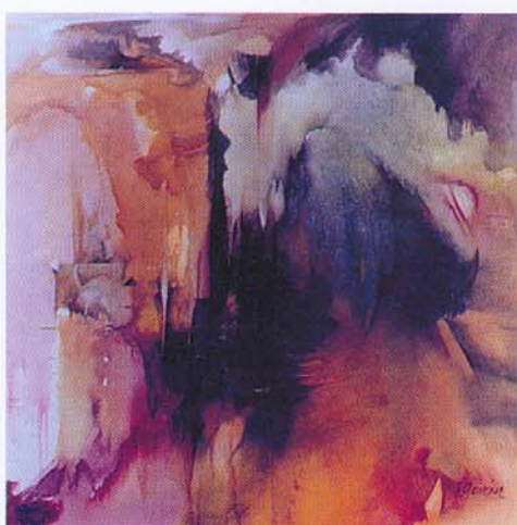
Desde Adentro, 1999 Acrílico 200 x 200 cm