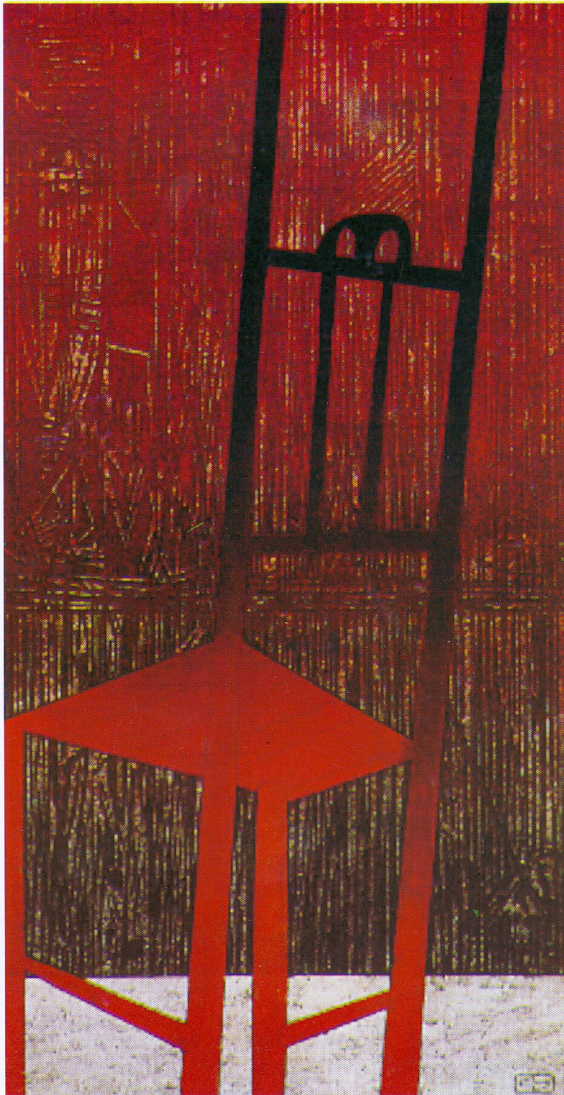
Te fuieste , 1994 Colagraf 100 x 50 cm