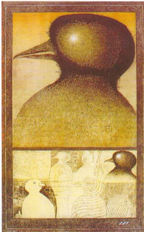
Aveamérica, 1996 Colagraf / 84 x 54 cm Primer Premio Adquisición XXXVII Salón Nacional de Grabado y Dibujo (Viedma, 1996)