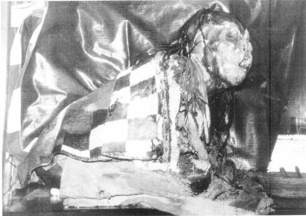
Figura 2. La momia, tal como se exhibió para la venta. 8.VIII.1985. (Foto gentileza Dr. J. C. Colombano).