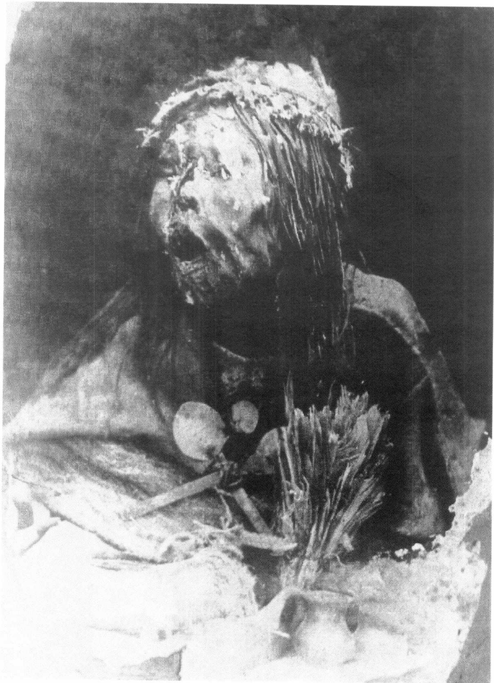
Figura 1. Foto de la "momia de los Quilmes" tomada por A. Sirolli en 1924. (Según Sirolli, 1957).