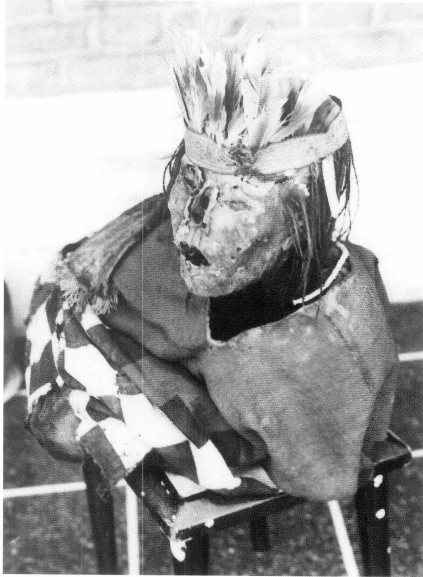
Figura 4. La momia en el "Museo Chavín de Huantar"..