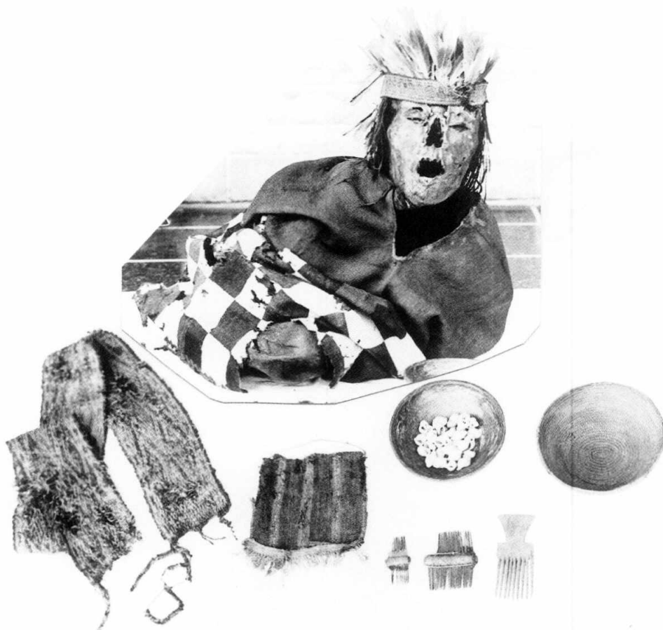
Figura 5. La momia y su ajuar, en el "Museo Chavín de Huantar", fotografiados en 1992 por J. Schobinger.