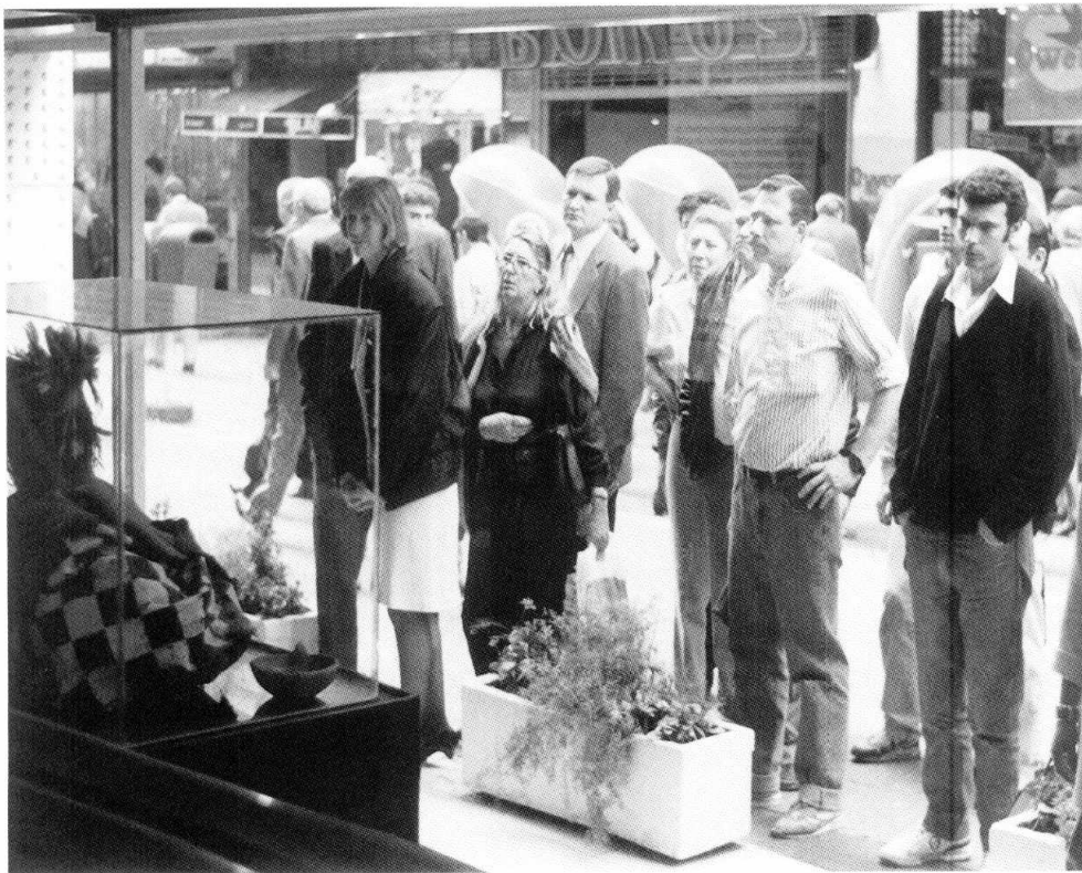
Figura 3. Primera exhibición pública de la "momia de los Quilmes" (1991). Vidriera del "Banco Ciudad", Florida y Sarmiento, Buenos Aires.