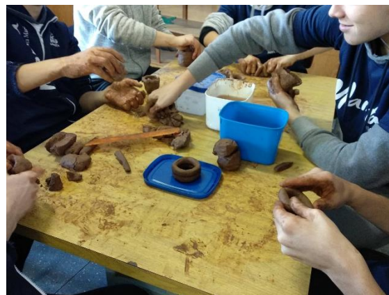
Acervo pessoal, 2018

17, 18 y 19 de octubre de 2018 Abaixo, imagem dos alunos participando da oficina II.