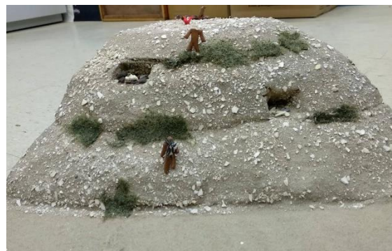
Exemplo maquete Sambaquis