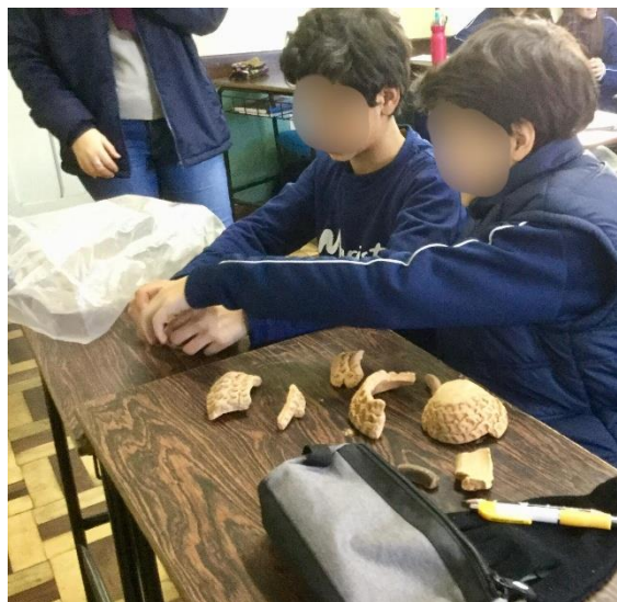
Acervo pessoal, 2018

Abaixo, imagem dos alunos participando da oficina III.