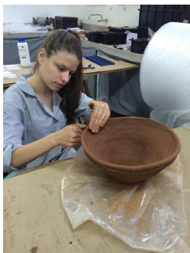
Acervo pessoal, 2017

Esses “roletes” são sobrepostos, seguindo angulações de abertura e fechamento, dando forma à vasilha que se almeja. A imagem a seguir mostra nosso trabalho enquanto arqueologia experimental.